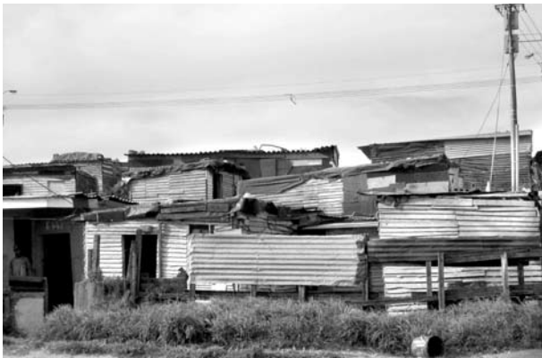
Informelle Siedlung namens «Europe» in der Nähe von Kapstadt.

Die eigene Ohnmacht und Rechtlosigkeit angesichts von Willkür und Gewalt bildeten die demütigende Grunderfahrung der schwarzen Bevölkerung Südafrikas vor und während der Apartheid. Auf den Farmen waren Auspeitschungen üblich zur Disziplinierung. Gewalt als Machtmittel wurde von den burischen Vorarbeitern auch in den Minen des Witwatersrand eingesetzt. Dazu kam für Millionen die gewaltsame Vertreibung aus Dörfern und Wohngebieten, die Erfahrung polizeilicher Willkür und Grausamkeit. Schwarze Frauen erfuhren die sexualisierte Machtausübung in Form von Vergewaltigungen, die im Allgemeinen straffrei blieben.