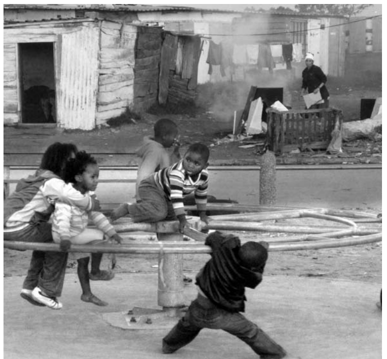
Einer der seltenen Kinderspielplätze im Township Philippi, Kapstadt.

Rassistische Einstellungen und Praktiken sind im heutigen Südafrika noch keineswegs Vergangenheit – wie sollten sie auch nach einer historisch so kurzen Zeit. Sie zeigen sich in der Behandlung von Hausangestellten, wie das Zitat von Hester Stephens von der Hausangestellten-Gewerkschaft belegt. FarmarbeiterInnen berichten, dass Körperstrafen auf den Farmen immer noch gang und gäbe sind und dass sich die Betroffenen nicht getrauen, deswegen Anzeige zu erstatten. Womöglich sind die xenophoben Übergriffe der letzten Jahre auf Migranten auch ein Erbe der rassistischen Tradition, in der alles «Andere» systematisch ausgegrenzt bzw. vernichtet wurde.